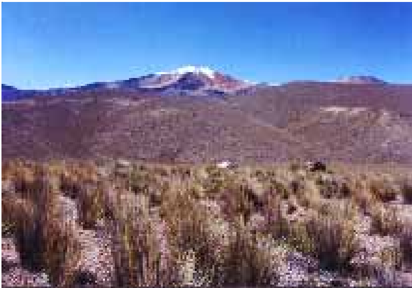
PAJONAL - TARATA