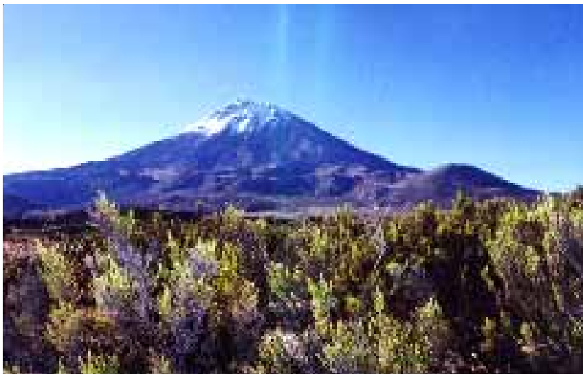
TOLAR - CANDARAVE