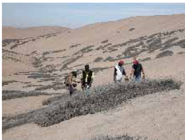
TILLANDSIAL - TACNA