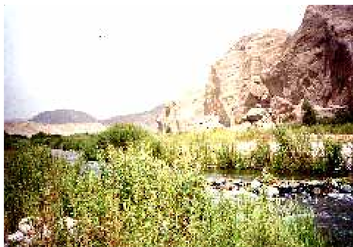
MONTE RIBEREÑO - SAMA