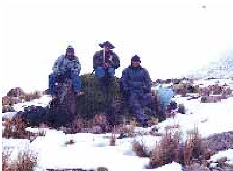
SUBNIVAL - CANDARAVE