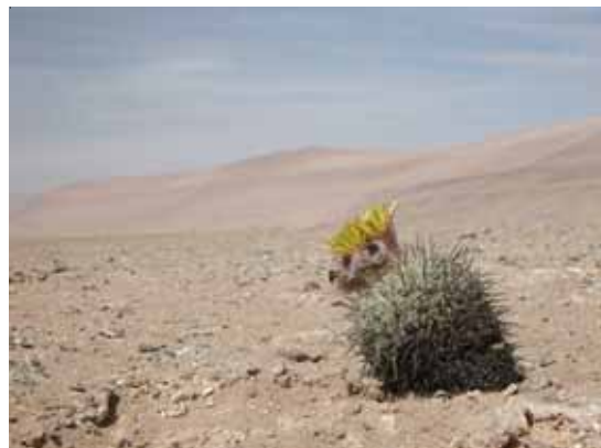
DESIERTO - PIEDRA BLANCA