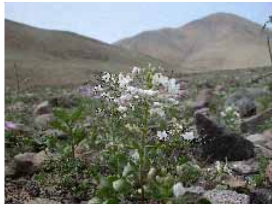
LOMAS - QUEBRADA DE BURROS