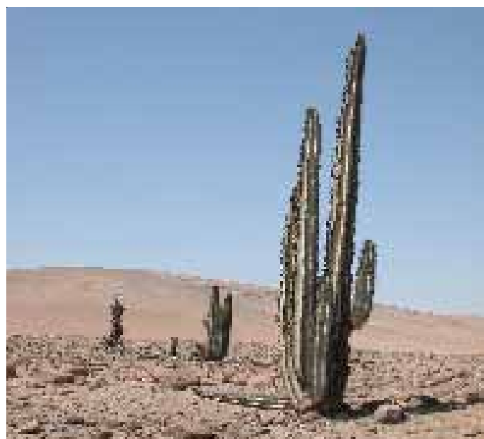
PISO DE CACTACEAS - LOCUMBA