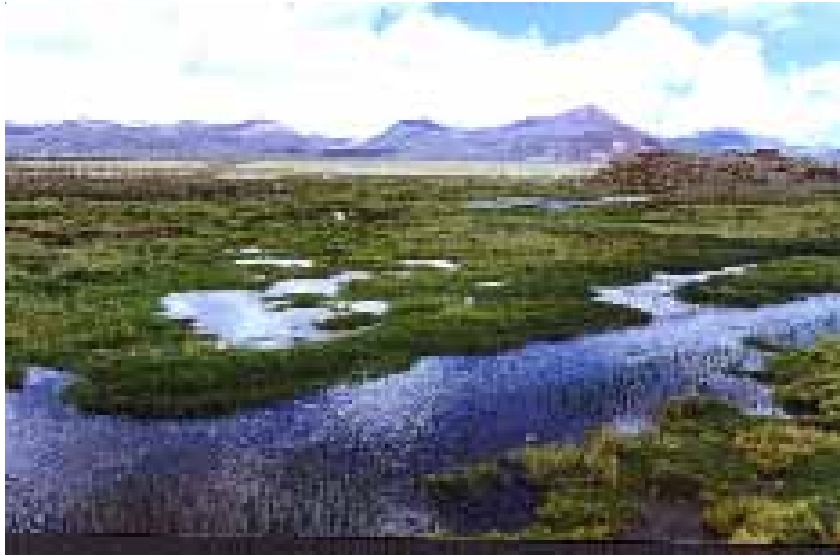
BOFEDAL - TRIPARTITO